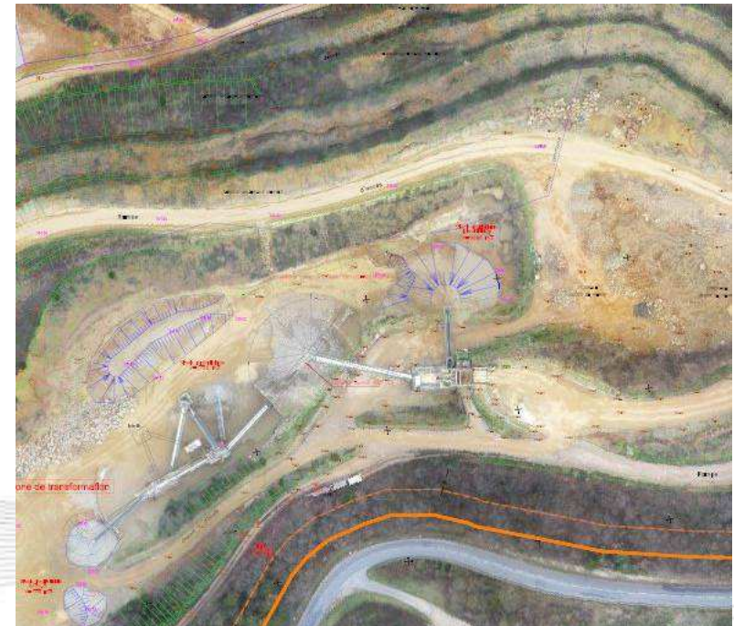
Exemple de rendu : extrait de plan topographique sur l'orthophotos.