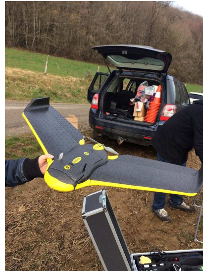
Drone à voilure fixe équipé d'un appareil photo de 16 mégapixels. (Société CARTODRONE)