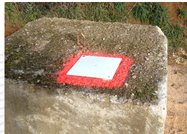
Exemple de repère permanent : Plaque 30x30, scellée sur bloc béton.