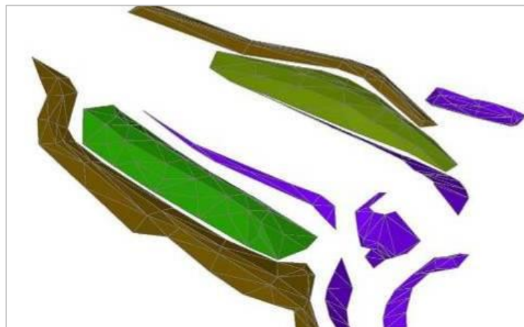
Exemple de vérification de cube