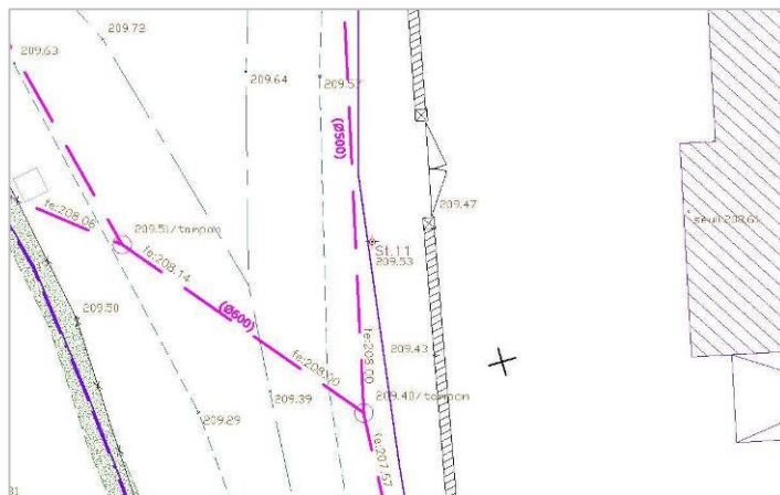
Extrait de plan de réseau d'assainissement

2016 - Réseau des eaux usées du SIA de la vallée du Drouvenant de CLAIRVAUX LES LACS