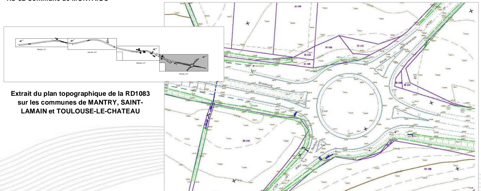
Extrait du plan topographique de la RD1083 sur les communes de MANTRY, SAINT-LAMAIN et TOULOUSE-LE-CHATEAU